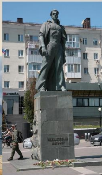
Памятник неизвестному матросу