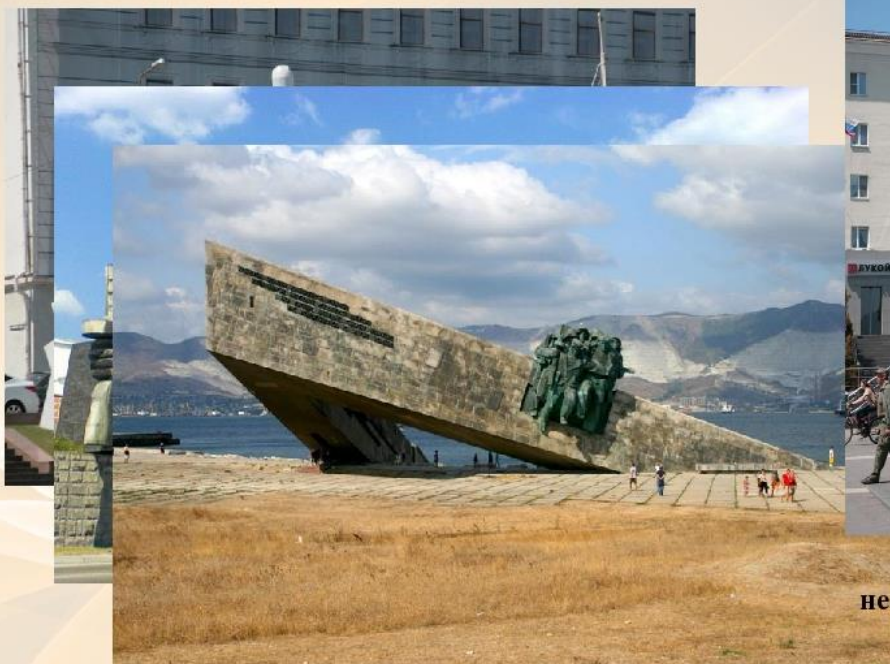
Мемориал "Малая земля»