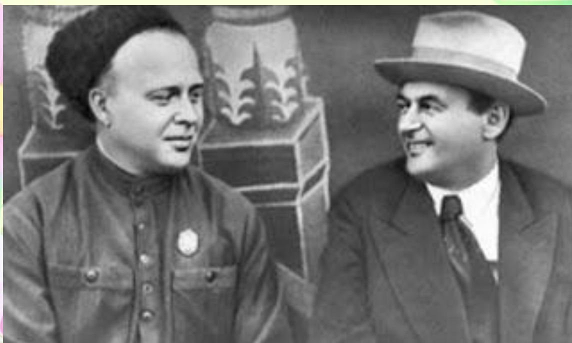
Р. Фраерман и А. Гайдар

В 1921 г. приехал в Москву. В 1924 г. здесь была издана первая повесть Фраермана «Васька-гиляк». В ней рассказывается о гражданской войне и становлении Советской власти на Дальнем Востоке. Вслед за ней выходят и другие книги – «Вторая весна» (1932) – первое произведение писателя для детей, «Никичен» (1934), «Шпион» (1937), «Дикая собака динго, или Повесть о первой любви» (1939) – самая известная повесть писателя.